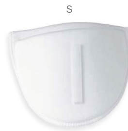
▲ 269 1201