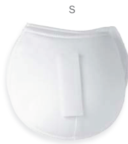
▲ 269 1101