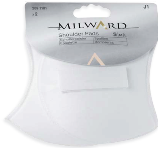
▲ 269 1101