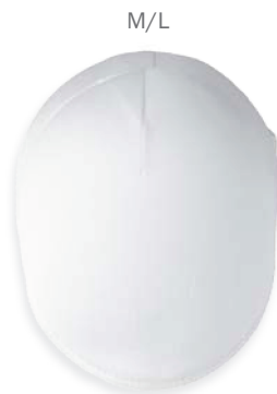
▲ 269 1105