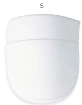
▲ 269 1203